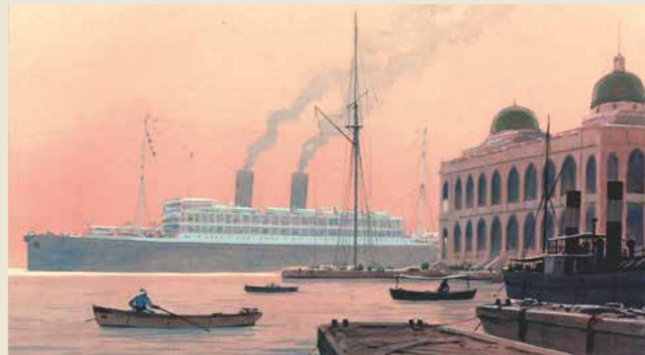
Le paquebot Paul Lecat à Port-Saïd par Sandy-Hook, début XX e siècle

la Compagnie des Indes avait déjà ouvert à Marseille l'accès à l'Asie par le cap de Bonne-Espérance. Les Marseillais envoient alors vers l'île Bourbon, l'île de France et l'Inde du vin, de l'eau-de-vie, de l'huile d'olive et du corail. Sur place, leurs navires se chargent de café, de bois, d'épices, de cotonnades et de soieries. Et en 1862, la Compagnie de navigation des Messageries impériales inaugure une ligne entre Suez et Shangai, avec une prolongation vers Yokohama deux ans plus tard.