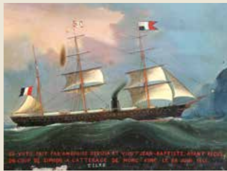
Paquebot mixte des Messageries Impériales, Le Tigre, 1865

Saïd Pacha qui en confie la réalisation à Ferdinand de Lesseps en 1854. L'utopie devient réalité sous le règne d'Ismaïl Pacha, le grand modernisateur de l'Égypte. Au travail forcé succède la puissance mécanique. L'ouverture du canal coïncide avec le triomphe de la navigation à vapeur. Sa première vocation est commerciale et ouvre de nouveaux horizons pour les Européens, en pleine période d'expansion coloniale. Le défi technique relevé sur 162 km marque l'entrée dans un monde où les distances raccourcissent et les échanges s'accroissent, dynamique toujours très actuelle.