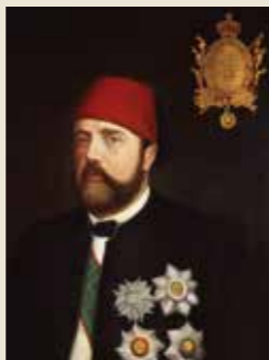
Ismaïl Pacha, vers 1870

L'isthme de Suez, au croisement de l'Afrique, de l'Europe et de l'Asie, s'inscrit dans la mythologie et l'histoire la plus ancienne mais également dans la géologie. Le pharaon Sésostris III (XIX e siècle av. J.-C.) aurait le premier fait creuser un canal entre le Nil et la mer Rouge, ouvert à la circulation, pendant plus de 20 siècles. En 1498, le Portugais Vasco de Gama emprunte la voie maritime du sud de l'Afrique pour rejoindre les Indes. Face à cette menace, Venise, qui avait fondé son existence et sa fortune sur le commerce avec l'Orient, fait alors la proposition de création d'un nouveau canal au sultan mamelouk, mais en vain.