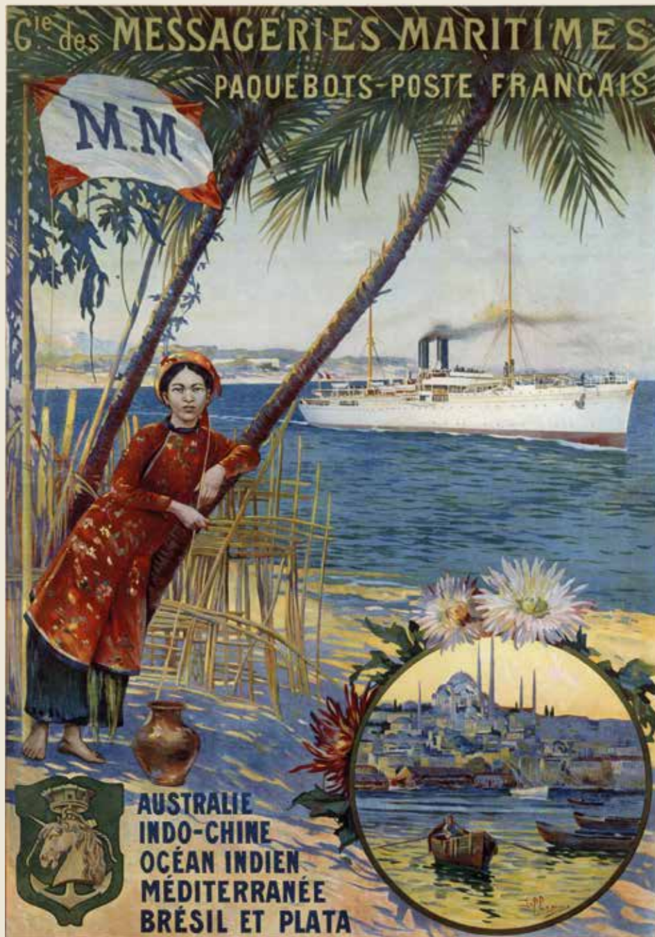
Compagnie des Messageries maritimes par David Dellepiane, 1910 © French Lines & Compagnies